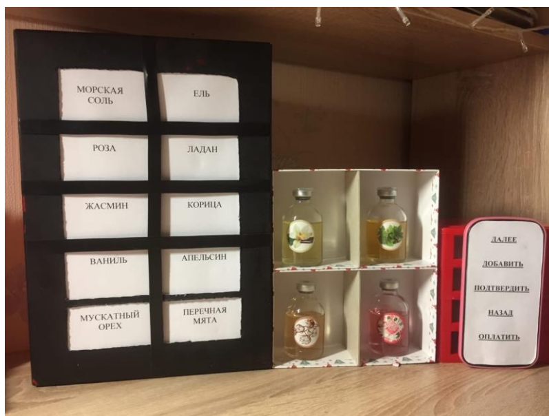
Аппарат для изготовления масленных духов (рис.2)